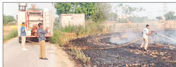
रेवाड़ी। खेत में लगी पर काबू पाते दमकल कर्मी।