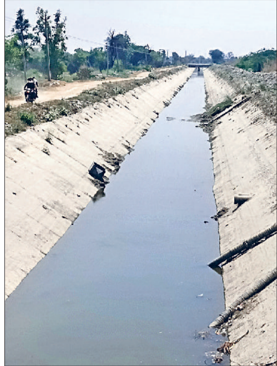
रेवाड़ी। 22 मार्च से बंद पड़ी जेएलएन नहर।

जोएलाएन नहर आने में देरी होने के कारण लोगों को राशनिंग करके पानी दिया जा रहा है। 19 अप्रैल को नहर आने की पूरी संभावना है, जिसके दो दिन बाद पानी की हलाई सुचारु हो पाएगी। -सुनील कुमार, जेई, जनस्वास्थ्य विभाग।