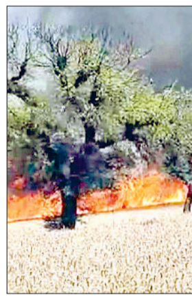
मंडी अटेली। राता कलां में गेहूं की फसल में लगी आग।

गांव राता कलां में वीरवार दोपहर करीब एक बजे उस वक्त बड़ा हादसा हो गया, जब एक किसान की खड़ी गेहूं की फसल में अचानक आग लग गई। तेज हवा एवं गर्मी के चलते आग ने कुछ ही मिनटों में विकराल रूप धारण कर लिया और करीब 12 एकड़ में खड़ी फसल जलकर पूरी तरह राख हो गई। ग्रामीणों ने तुरंत फायर ब्रिगेड को सूचना दी, लेकिन सबसे गंभीर बात यह रही कि दमकल विभाग की गाड़ी करीब एक घंटे की देरी से मौके पर पहुंची। इस दौरान आग लगातार फैलती रही और आसपास के खेतों को भी अपनी चपेट में लेती गई। ग्रामीणों का कहना है कि यदि फायर ब्रिगेड समय पर पहुंच जाती तो नुकसान को काफी हद तक रोका जा सकता था। गांव के लोगों में इस देरी को लेकर खासा रोष देखने को मिला। ग्रामीणों ने आरोप लगाया कि