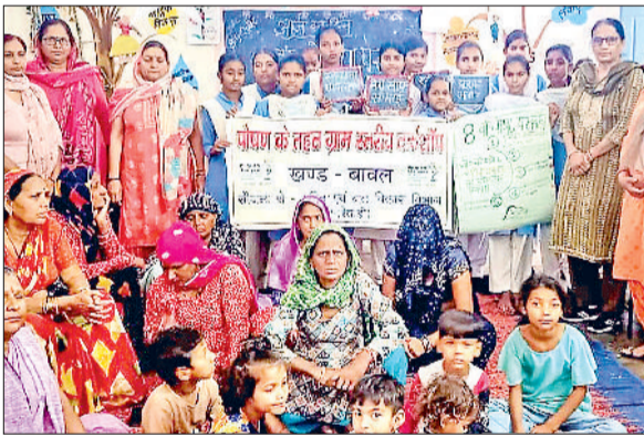
रेवाड़ी। कार्यक्रम में मौजूद महिलाएं व बच्चे।