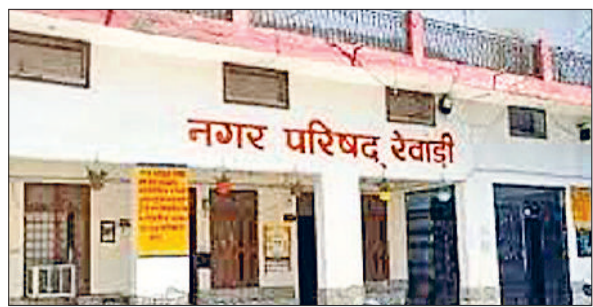
रेवाड़ी। नगर परिषद कार्यालय का फाइनल फोटो

निकाय चुनावों में कांग्रेस की वीरवार को दिल्ली में हुई कोमेटी की मीटिंग में एक ओर जहां पहली बार वाई पाई पार्षद के चुनाव भी संबल पर लड़ने को हरी झंडी दिखा दी गई, वहीं दूसरी ओर चेयरमैन की टिकट एक बार फिर आम कार्यकर्ता की जगह 'खास' की झोली में ही डल सकती है। आम कार्यकर्ता को टिकट के लिए निराशा का सामना करना पड़ सकता है। नगर परिषद के पिछले चुनावों में कांग्रेस कार्यकर्ताओं को उम्मीद थी कि पार्टी किसी आम कार्यकर्ता को चेयरमैन की टिकट