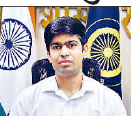
रेवाड़ी। डीसी अभिषेक मीणा।

हरियाणा राज्य निर्वाचन आयोग की ओर से जिले में पंचायती राज संस्थाओं के रिक्त पदों पर उप चुनाव 10 मई को कराए जाएंगे। जिला निर्वाचन अधिकारी एवं डीसी अभिषेक मीणा ने बताया कि 10 मई को होने वाले उप चुनाव के कार्यक्रम का नोटिफिकेशन जारी कर दिया गया है। डीसी ने बताया कि पंचायती राज संस्थाओं के रिक्त पदों के लिए होने वाले उप चुनाव कार्यक्रम के तहत उम्मीदवार 21 अप्रैल से 25 अप्रैल तक बीच सुबह