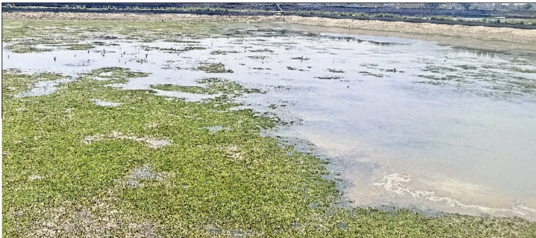
रेवाड़ी। कालाका वाटर वर्क्स में कम हुआ पानी का स्तर।

अप्रैल माह में ही गर्मी पूरी तरह अपने तेवर दिखाने लगी है। गर्मी बढ़ने के साथ ही शहरवासियों के लिए पानी की किल्लत शुरू हो गई है। गर्मी बढ़ने के साथ ही पानी डिमांड भी बढ़ गई है। आगामी मई, जून व जुलाई में पानी की किल्लत लोगों और भी परेशानी पैदा करने वाली है। पिछले एक दशक से शहर के लोगों को सही हो या गर्मी किरतों में पानी मिलता आ रहा है। नहरी पानी समय पर नहीं आने की स्थिति में शहर के लोगों को पानी के लिए तरसना पड़ता है। एक दशक से जन स्वास्थ्य विभाग स्टोरेज की क्षमता कम होने के कारण गर्मी के मौसम में पानी की आपूर्ति अल्टरनेट-डे करता आ रहा है। समस्या उस समय और भी विकराल हो जाती है, जब नहरी पानी का आपूर्ति में विलंब हो जाता है। शहर के लोगों को टैकरों से पानी खरीदना पड़ता है। जिले में 22 मार्च को नहर में पानी आना बंद हो गया था, जिसके बाद 13 अप्रैल को पानी आना था, लेकिन अभी तक खूबड़ हेड से नहर में पानी नहीं छोड़ा गया है। पब्लिक हेल्थ के अधिकारियों के अनुसार अब नहर में 19 अप्रैल को पानी पहुंचने की संभावना है।