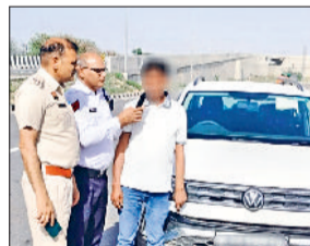
रेवाड़ी। कार चालक में शराब की मात्रा चेक करती पुलिस।

जिला पुलिस की ओर से ट्रिंक एंड ड्राइव, ध्वनि प्रदूषण और लेन चेंज के नियमों की अवहेलना करने वाले वाहन चालकों पर शिकंजा कसा जा रहा है। बीते सप्ताह ट्रैफिक पुलिस की ओर से यातायात के नियमों का उल्लंघन करने वाले 875 वाहन चालकों पर कार्रवाई की गई। पुलिस की ओर से चलाए गए ट्रिंक एंड ड्राइव अभियान के तहत शराब पीकर वाहन चलाने वाले 8 वाहन चालकों के चालान किए गए।