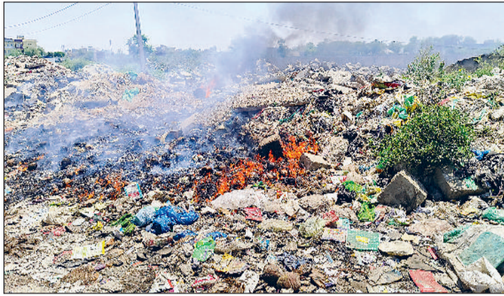
रेवाड़ी। कंटेनर डिपो में जलाया गया कचरा और सचिवालय के पीछे सड़क पर डाला गया सीएंडडी वेस्ट।

कंटेनर डिपो पर कूड़े के ढेर में आग लगाई जा रही है। कचरा जलाने से उठने वाला जहरीला धुआं आसपास के क्षेत्रों, कार्यालयों और जिला सचिवालय