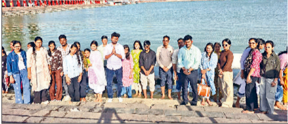
रेवाड़ी। शैक्षणिक भ्रमण के दौरान विद्यार्थी।

इंदिरा गांधी विश्वविद्यालय के इतिहास विभाग के विद्यार्थियों एवं शोधार्थियों ने कुरुक्षेत्र विश्वविद्यालय में आयोजित अंतरराष्ट्रीय सम्मेलन में सक्रिय भागीदारी की। सम्मेलन इतिहास, संस्कृति एवं पुरातत्व विभाग, श्रीमद् भगवद् गीता अध्ययन केंद्र, इंडियन कार्टिसिल ऑफ हिस्टोरिकल रिसर्च, नई दिल्ली तथा विज्ञान कुरुक्षेत्र के संयुक्त तत्वावधान में आयोजित किया गया। सम्मेलन में देश-विदेश से पधारे विद्वानों, शोधकर्ताओं एवं अकादमिक विशेषज्ञों ने कुरुक्षेत्र क्षेत्र से संबंधित प्राचीन, मध्यकालीन तथा आधुनिक इतिहास के विविध आयामों पर अपने शोध पत्र प्रस्तुत